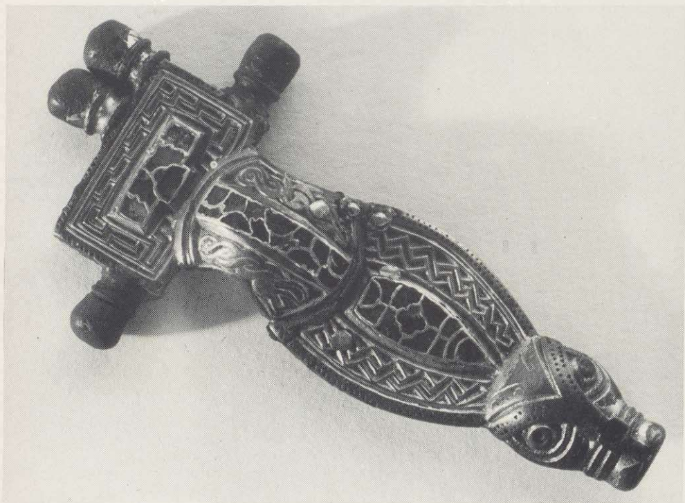
Silbervergoldete Tierkopffibel mit Almandineinlagen aus Pflaumheim, Lkr. Aschaffenburg. Schmuckbeigabe einer wohlhabenden, um 600 n. Chr. verstorbenen Dame der fränkischen Oberschicht. Länge der Fibel 11,0 cm.

Das Mainfränkische Museum Würzburg auf der Festung Marienberg zeigt im Sommer und Herbst 1983 in einer großen Sonderausstellung "Schätze aus Bayerns Erde" und erinnert damit an das Wirken des Bayerischen Landesamtes für Denkmalpflege, Abteilung Vor- und Frühgeschichte. Denn vor 75 Jahren wurde diese Abteilung begründet und die erste Außenstelle des Amtes in Würzburg installiert. Die Ausstellung vereinigt in eindrucksvoller Weise kostbare und bedeutende Funde aus ganz Bayern, die in den vergangenen Jahrzehnten dem Dunkel der Vergessenheit entrissen wurden. Die lange Reihe der weit über 1000 Ausstellungsstücke, die aus zahlreichen Museen und Privatsammlungen stammen, ermöglicht ein faszinierendes Bild kultureller Entwicklung von der Altsteinzeit bis hin in das späte Mittelalter. Besondere Höhepunkte hat die Schau in so weltberühmten Objekten wie dem "Goldhut" von Etzeldorf-Buch, dem Kultwagen von Acholshausen, dem Schatzfund von