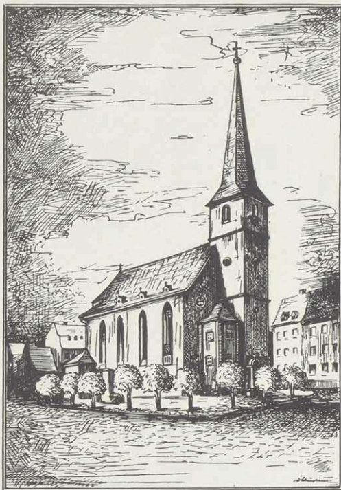
St. Gertraud (einst und jetzt wieder).

Der Name des Pleicherviertels – noch bis in die neueste Zeit eine eigenständige und originale Vorstadt Würzburgs – kommt von der Pleichach, einem gelegentlich recht kräftigen Bach. Die "Pleich", wie das Viertel von seinen Bewohnern genannt wird, ist die Abkürzung des Bachnamens "Blei-haha" und bedeutet Bleichwasser und dürfte wohl bis in die karolingische Zeit zurückgehen. Bleichwasser deshalb, weil das von Wiesen umgebene Gewässer, mit diesen zusammen zum Wäschebleichen diente. Es floß, nach der Vereinigung der Bäche Riederbach und Wertbach bei Unterpleichfeld an Mühlhausen, Maidbronn, Rimpar und Versbach vorbei bzw. hin-