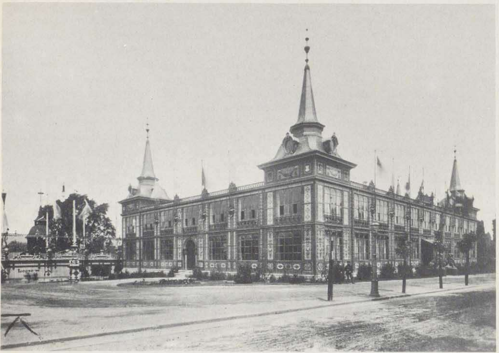
Die alte Eisenhalle von 1882 (Eisenbahnmuseum) am Gewerbemuseumsplatz