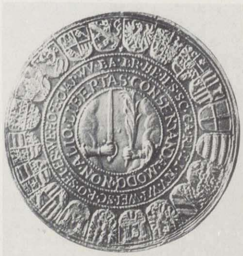
Kreisobristenmedaille des Markgrafen Christian Ernst 1673. Die Rückseite zeigt die Wappen der fränkischen Kreisstände.