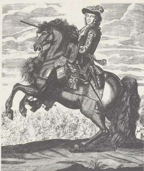
CHRISTIANUS ERNESTUS Paragruppi in Brunnentempel Der vom Kaiser als Capit. General, also die Cavallerie, und die Alerten General Feldmarschal, auftrug

Markgraf Christian Ernst nach einem zeitgenössischen Kupferstich