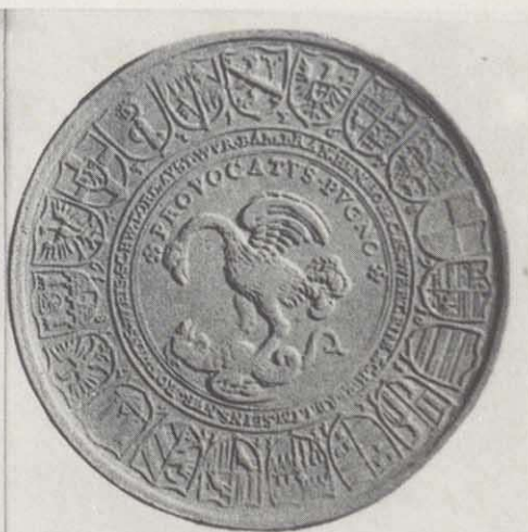
Kreisobristenmedaille des Markgrafen Christian (1603–1655). Der Revers zeigt den brandenburgischen Adler im Kampf mit einem liegenden Untier und der Umschrift "Provocatus pugno"