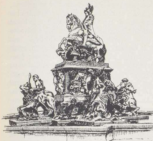
Der Bayreuther Markgrafenbrunnen mit liegendem Türken und Zwerg sowie den Allegorien der Erzteile (Elias Rantz 1699–1705). Federzeichnung: W. W. Wirth. Ohne Retusche

der Markgrafenbrunnen zusammen mit der figuralen Plastik des Alten Schlosses, ja mit der gesamten Schloßanlage gesehen werden sollte, hat den Verfasser dieses Aufsatzes zu Untersuchungen veranlaßt, die erstmals 1976 im "Archiv für Geschichte von Oberfranken" ausführlich veröffentlicht wurden. Erste, wenn sicher auch noch nicht abschließende Ergebnisse haben gezeigt, daß sich auch für den älteren Bayreuther Schloßbaukomplex die Richtigkeit der alten Weisheit bestätigt, daß das Ganze mehr ist als die Summe seiner Teile. Aus Raumgründen kann im folgenden allerdings nur in Grundzügen angedeutet werden, welche Aussagen in der Bayreuther Schloß- und Marktplatzskulptur immer noch oder weniger deutlich erkennbar sind.