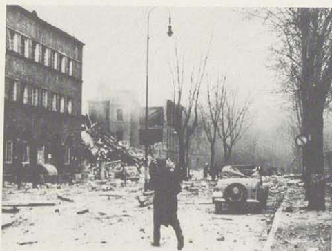
Bürgerreuther Straße, links Hauptpostamt

Der nächste Angriff erfolgte in der Nacht vom 10. auf den 11. April, wobei einige Bomben auf dem Hans-Schemm-Platz, dem heutigen Luitpoldplatz, einschlugen und das Neue Rathaus, sowie das Haus der Deutschen Erziehung beschädigten.