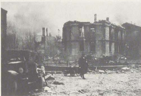
Wilhelmsplatz, kurz nach der Bombardierung

Der letzte aber zugleich furchtbarste Fliegerangriff ereignete sich am Tag darauf, am 11. April 1945.