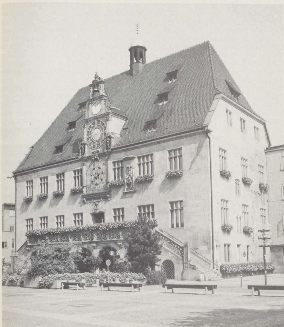
Historisches Rathaus.