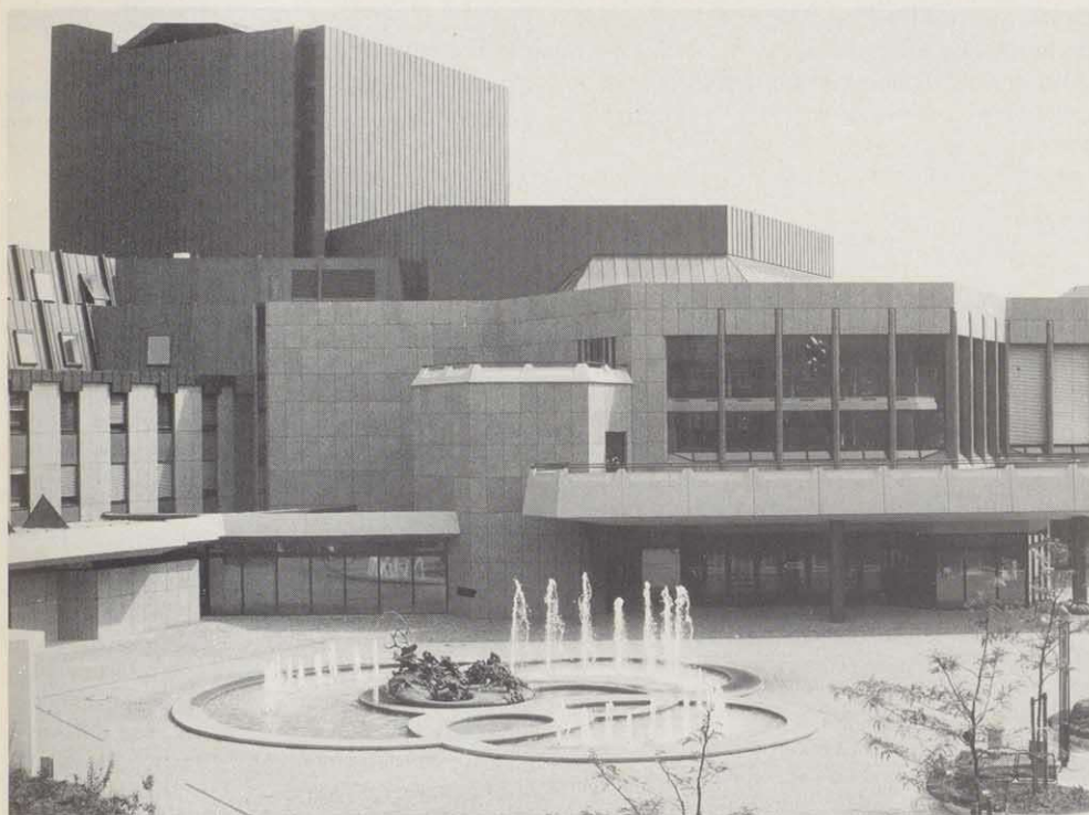
Stadttheater mit Theaterbrunnen.

alemannischen und fränkischen Fachwerkbauten jener alten Reichsstadt Heilbronn, welche Goethes Schauspiel "Goetz von Berlichingen" und Kleists "Käthchen von Heilbronn" sozusagen zum Prototyp der mittelalterlichen deutschen Stadt gemacht hatte.