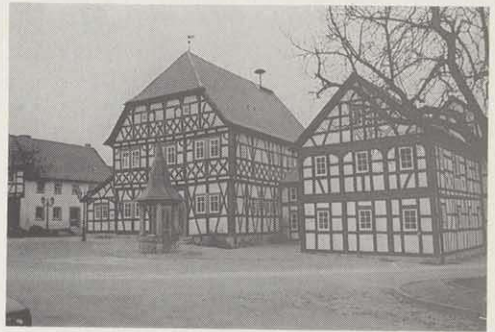
Rathaus, Vorderfront mit Brunnen