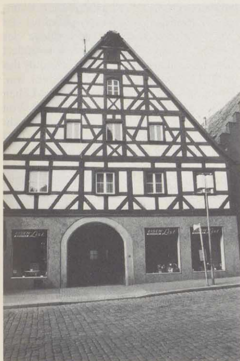
Geburtshaus Johannes Scharrers, Hersbruck, Unterer Markt 18. Das Haus mit dem schönen fränkischen Fachwerkgiebel stammt aus dem späten 17. Jahrhundert. In der Nachkriegszeit wurde das Erdgeschoß durch Einbau von Geschäftsräumen verändert. Links am Bildrand ist die Gedenktafel zu erkennen. Die ehemals drei Dachböden dienten zum Trocknen und Lagern des Hopfens. Typisch ist die Aufzugsgaube, die "Dachnase".