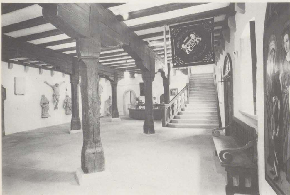
Die sog. "Rüstkammer". Vortragsraum, Empfangshalle, Sitz des Verkehrsamtes, nimmt das ganze Erdgeschoß ein. An der Längswand eine Aufreihung von Denkmälern