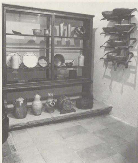
In der ehemaligen Heizkammer zum Sitzungssaal ist altes Küchengeschirr ausgestellt