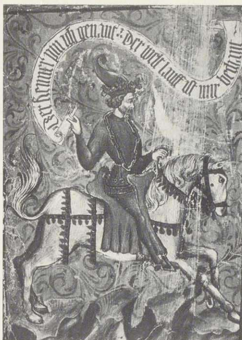
Hugo von Trimberg aus Wern. Titelbild der Leidener Pergament-Renner-Handschrift; Universitätsbibliothek Leiden

werden: Die Geldsäcke, die Hoffärtigen und Rechtsverdreher sind ihm die ärgsten Bösewichter; sie verkehren die Ordnung der Dinge. Immer wieder bringt er Beispiele, wie Bosheit, Spielsucht und Müßiggang die führenden Stände verderben und zu Nutznießern der Konjunktur machen: Denn alles strebt nach Reichtum und schaudert nicht vor Lüge, Unrecht und Meineid zurück. Die Untreue aber führt zu aller Schlechtigkeit und die Welt ist derselben so voll, daß der Antichrist nahe zu sein scheint. Könnte ein Prediger oder Sittenschilderer unserer Zeit den praktischen Materialismus unserer westlichen Welt schärfer kennzeichnen?