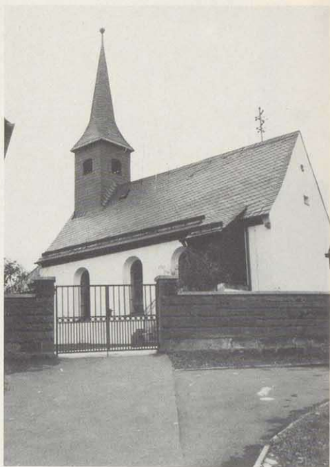
Kirche in Stockau