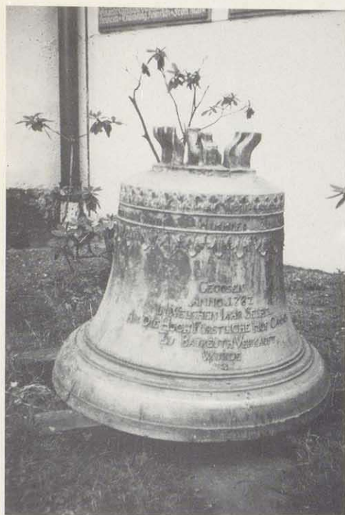
Himmler-Glocke in Selbitz

Bei der erwähnten Schiffshütte kann man zunächst an das im Riedigerplan von 1745 eingezeichnete Gebäude am Nordufer des Sees denken. Da diese erste Schiffshütte aber auf erhaltenen Plänen 1780 nicht mehr eingezeichnet ist, war sie wohl zu Himmlers Zeit schon abgetragen. Im "Geometrischen Grundriß" des Ingenieurleutnants Johann Friedrich Weiß ist aber in Verlängerung der Matrosengasse ein Gebäude eingetragen, das als Schiffs-Stadel bezeichnet wird. Dieses Grundstück dürfte mit dem von Himmler erworbenen identisch sein, da die Urkunde vom 30. 8. 1781 ausdrücklich von einer Schiffshütte bei den Matrosenhäusern spricht. Nach dem Verkauf an Himmler wurde der Hofkammer aus einem Land schaftsprotokoll mitgeteilt, Artillerie und Wagenfarth aus der Schiffshütte in die für jene von Alters her bestimmte Zeug-Schupfe wieder bringen zu lassen . Man sprach also