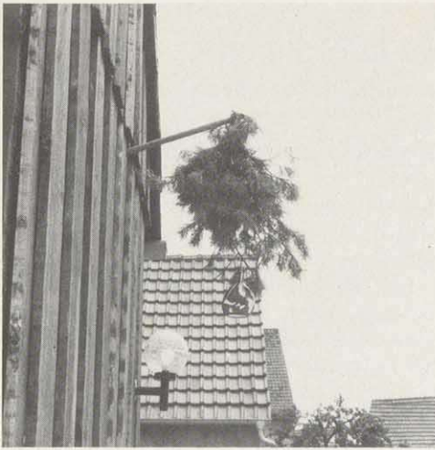
Fichtenwedel mit Bocksbeutel an einer Heckenwirtschaft in Rödelsee (Lkr. Kitzingen)