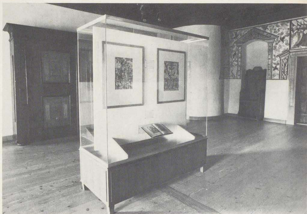
Im Betsaal des Thünaflügels von Burg Lauenstein (Stadt Ludwigsstadt) sind die Originalwerke von Lucas Cranach d. Ä. ausgestellt.