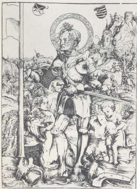
Heiliger Georg, stehend mit zwei Engeln. Holzschnitt, dat. 1506

Evangelist Johannes zu erkennen sind. Dieser ist in tiefster Ergriffenheit in ein Buch versunken, während die anderen drei Heiligen mit dem Blick nach oben den schwebenden Christus durch das Gebet verehren.