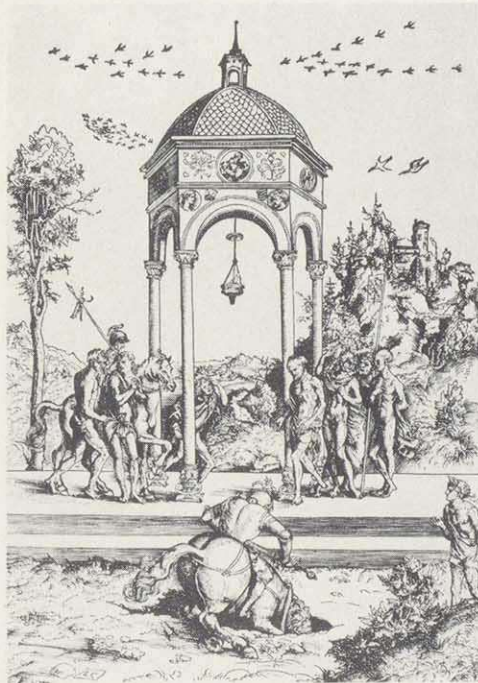
Der Opfertod des Marcus Curtius. Holzschnitt um 1506

Cranach bedient sich hier der Vorlage einer italienischen Bronzeplatte und greift erstmals ein Thema der Antike auf. Er übernimmt den zierlichen Renaissancetempel sowie in Seitenverkehrung die Figurengruppen. Statt des auf der Plakette sich abzeichnenden Fels- oder Erdabbruchs unterhalb des Tempels, setzt Cranach eine begrenzte Zweistufenbühne ziemlich unvermittelt in die heimatisch anmutende Landschaft. Die architektonische Beschaffenheit