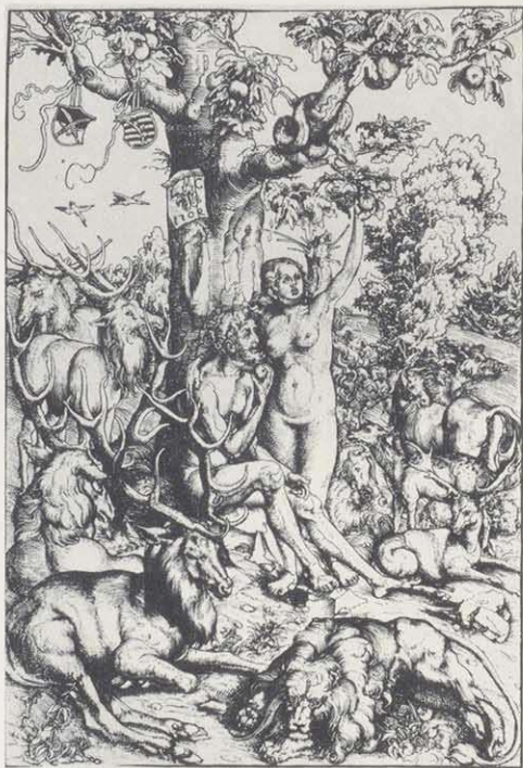
Adam und Eva im Paradies. Holzschnitt, dat. 1509

Das Thema wird von Cranach wiederholt in seinen Gemälden aufgegriffen, doch in keinem seiner Ölbilder erreicht er eine Wiedergabe des ersten Menschenpaares von solch gelöster, ungezwungener Haltung wie in diesem Holzschnitt. Cranach gestaltet das Thema als Idylle im Gegensatz zu Dürers berühmten Kupferstich mit der