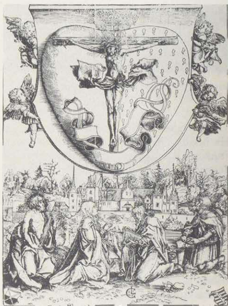
Verehrung des Herzens Jesu. Holzschnitt, dat. 1505

Das Blatt stellt in der gesamten oberen Hälfte des Bildes das Herz Jesu dar, in dessen Mitte in strenger symmetrischer Ordnung der schlanke Körper des Gekreuzigten hängt. Vier Engel halten den Wappenschild, der mit der Kreuzigungsszene über einer deutschen Landschaft schwebt. Ein schloßartiges Gebäude mit gotischen Giebeln und Türmen, bestimmt den Mittelgrund des Blattes. Die Realität erhöht der Meister durch ihm eigene besondere Details, die immer wieder in seinen Darstellungen erscheinen: rauchende Schornsteine, die von der Gegenwart des Menschen künden, zwei schreitende Hirsche, Lieblingstiere des Malers, und ein im Wasser schwimmender Schwan. Der Vordergrund des Bildes jedoch wird durch eine kniende Heiligengruppe bestimmt. In symmetrischer Ausgewogenheit des Holzschnittes ordnet er zunächst der linken Bildhälfte den Heiligen Sebastian und die Heilige Maria zu, während von rechts der Heilige Rochus und der