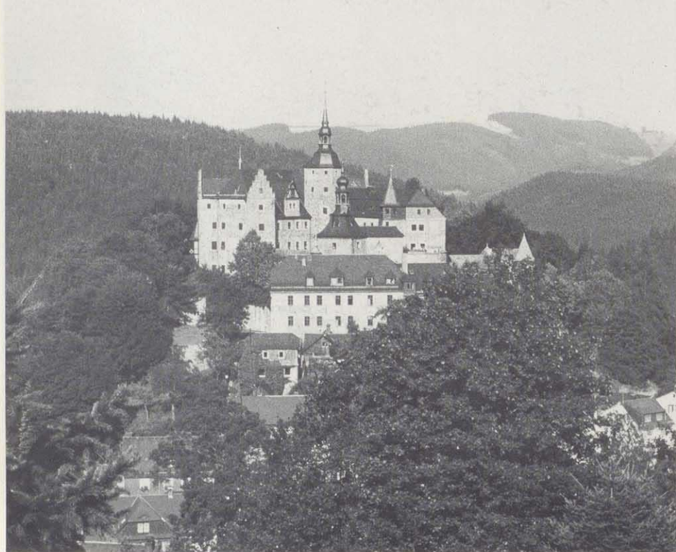
Burg Lauenstein bei Ludwigsstadt