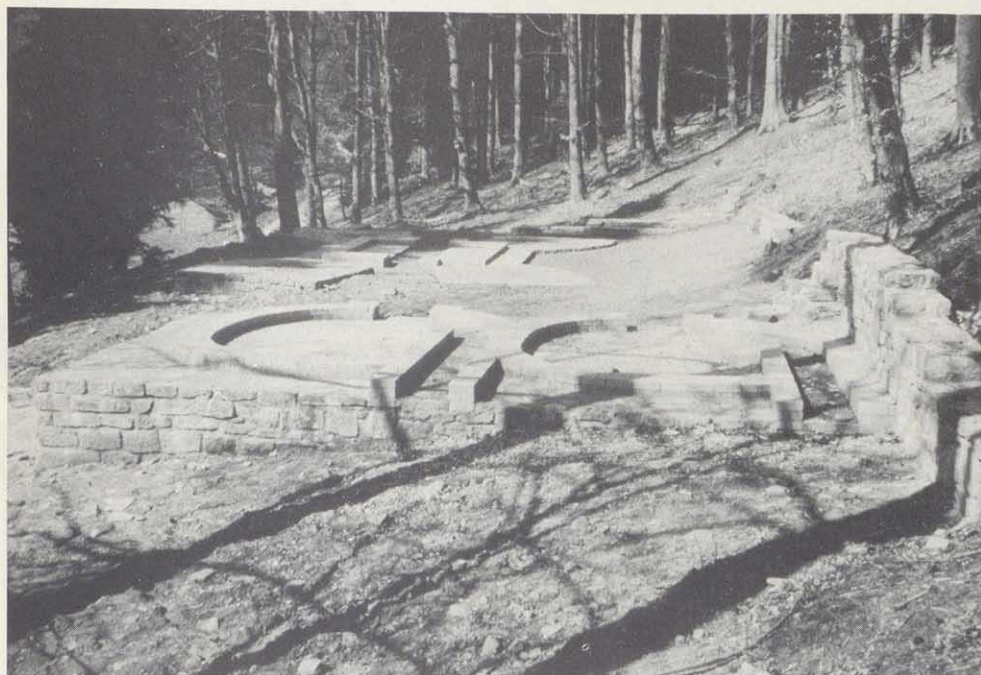
Freigelegte Glashütte im Forstamt Schöllkrippen