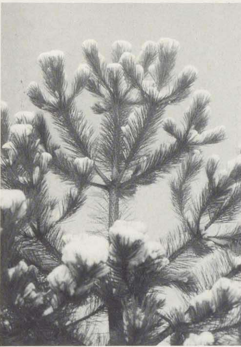
Kiefer im Winterschmuck

Tore öffnen sich, auf stolzen Rossen sprengen die Ritter hinaus, der Zauber des Waldes umfängt sie." So werden sie ihn erlebt haben, den erwachenden Tag im Wald: das Wispern des Windes in den Baumkronen, den sich mehrenden und steigenden Gesang der Vögel, den Ausgang der Sonne und das Brechen der Strahlen in den Zweigen und an den Blättern. Dies kann im Menschenherzen Stimmungen erzeugen: Staunen, Freude, Frieden, Andacht. In diesem "grünen Zelt" konnte Joseph v. Eichendorff sich wohlfühlen und singen: "Oh schöner, grüner Wald, du meiner Lust und Freude, andächt'ger Aufenthalt", ein Lied, das mit anderen zum Repertoire jedes Gesangsvereins zählt. Bert Brecht hat die Frage gestellt: "Weißt du, was ein Wald ist? Ist ein Wald etwa zehntausend Klafter Holz? Oder ist er eine grüne Lebensfreude?" Der Wald führt uns zur Kunst. Er ist ein Phänomen, das in einer schier unerklärlichen Weise Emotionen weckt. Aber – er ist auch zehntausend Klafter Holz.