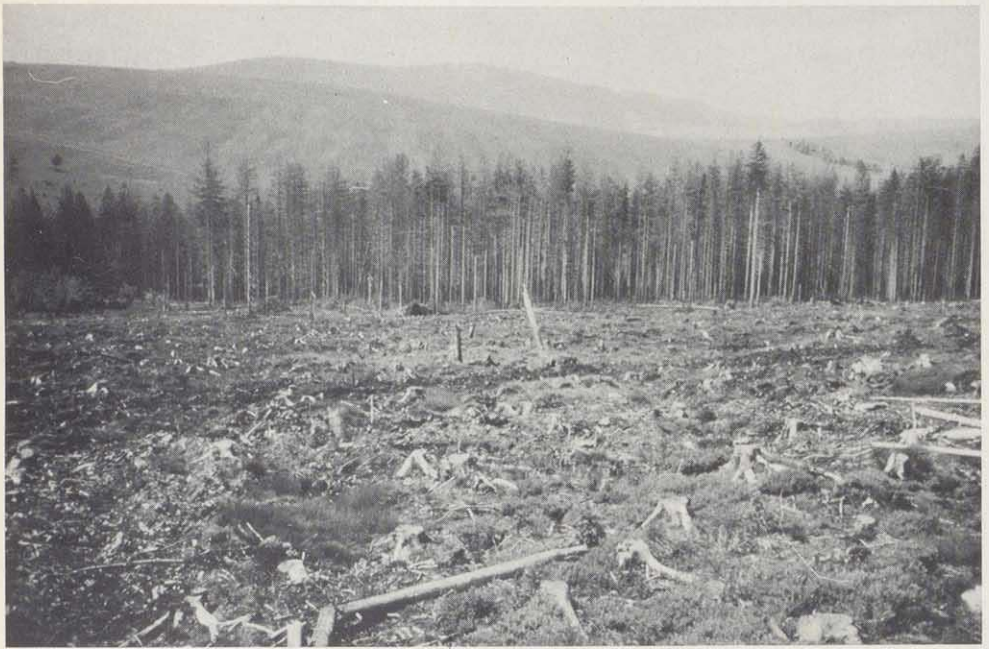
Abgeräumter, toter Wald unterhalb des Keilberges (CSSR) mit Blick auf den Fichtelberg bei Oberwiesenthal (DDR), Foto 1984. Im Jahre 1983 stand der "Geisterwald" noch und schützte den noch stehenden Bestand, der nun zu ca. 60% abgestorben ist und in diesem Jahr mit an Sicherheit grenzender Wahrscheinlichkeit total tot ist.