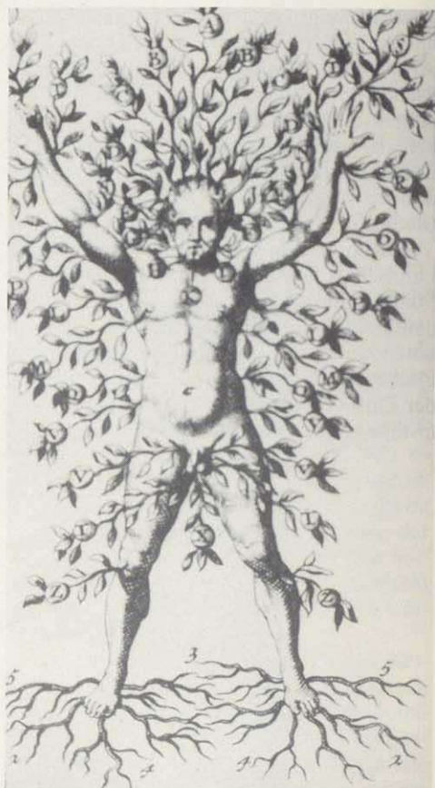
Der Pflanzenmensch – Kupferstich aus dem "Compendium Anatomicum nova Methodo institutum". Amsterdam 1696. Aus "Bäume" von Gerda Gollwitzer, Schuler Verlagsgesellschaft Herrsching

Die frühgeschichtliche Besiedlung unseres mitteleuropäischen Raumes nahm sicher von einigen waldfreien Flächen ihren Ausgang. Angrenzende Waldränder ließen sich dann durch Rodungen öffnen, Lichtungen entstanden, die sich zur Viehweide eigneten, der Waldboden erwies sich tauglich für primitive landwirtschaftliche Nutzung. Eine zweite und sehr mächtige Rodungswelle löste die Völkerwanderung aus, bis endlich im 15. Jahrhundert die Waldverteilung erreicht wurde, wie wir sie heute