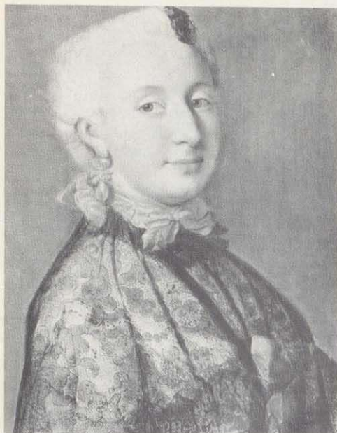
Markgräfin Wilhelmine (Pastell von Jean Etienne Liotard um 1745)

hegelegenes Jagdhaus gebracht, wo man ohnedies bereits Vorbereitungen für die anderen Begleiter des Königs getroffen hatte. Aus dem vom König zugebilligten kleinen Imbiß wurde dort doch etwas mehr. Im Bericht des Bamberger Obermarschalls ist zu lesen, daß die beste Species, woran es nämlich nit gefehlet, zur Bedienung des Kronprinzen in das Jagdhaus haben können verschaffet werden. Das Mahl, welches Seine Königliche Hoheit nebst sechs königlichen Offizieren mit gutem Appetit verzehrten, auch bei dieser Freiheit ganz vergnügt sich bezeiget, dauerte bis gegen Mitternacht. Als der König längst schlief, zogen sich die Teilnehmer des heimlichen Gelages in größter Stille zum Schlafen in die benachbarte Scheune zurück, so daß der König von den „Spätheimkehrern“ nichts mehr merkte. Nur der Obermarschall notierte, daß bei diesem Nachtschwarm ein mehreres nit verloren gegangen als ein Nachtsilber und drei zinnerne Teller. – Für die Nachwelt wurde diese Übernachtung später auf einer Gedenktafel am Haus Memmelsdor-