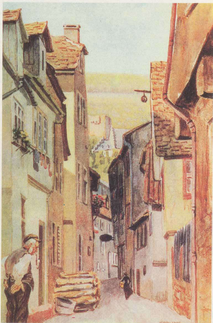
Isidor Lang (1887–1929): Blick durch die Fischergasse (Aus der Serie "Alte Miltenberger Ansichten nach Aquarellen von I. Lang", herausgegeben von der Stadt Miltenberg)