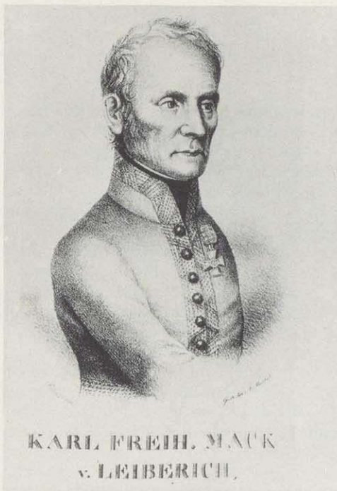
KARL FREIH. MACK v. LEIBERICH.

Österreich, gerichtet hatte, ohne damals Gehör zu finden, denn ein Wiener Kriegsgericht verurteilte den unglücklichen General zum Verlust seiner Charge, aller Orden und zu achtjähriger Festungshaft, nachdem Militärprokuratoren für ihn lebenslänglich, ja sogar die Todesstrafe gefordert hatten. Aber schon die Tatsache, daß Kaiser Franz diese ungewöhnliche Bestrafung seines Heerführers alsbald im Gnadenwege auf zwei Jahre herabsetzte und seine Rehabilitation in die Wege leitete – wie es hieß, auf Drängen seines Bruders Erzherzog Karl, der 1805 die Italien-Armee der Österreicher kommandiert hatte und 1809 Napoleon erstmals bei Aspern besiegte – ließ erahnen, daß böse Intrigen gegen Karl Mack im Spiel gewesen sein mußten. Ehe jedoch deren Analyse von mir versucht wird, ist es nötig, den Lebenslauf des fränkischen Generals mit seinen wichtigsten Stationen in Augenschein zu nehmen.