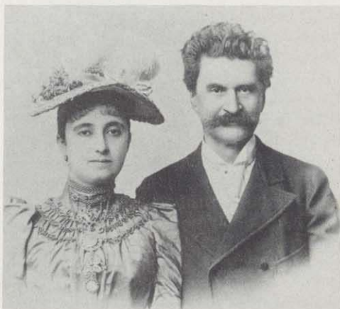
Adele und Johann Strauß