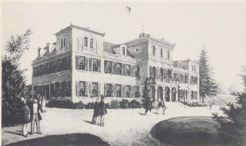
Schloß Fantaisie um 1850