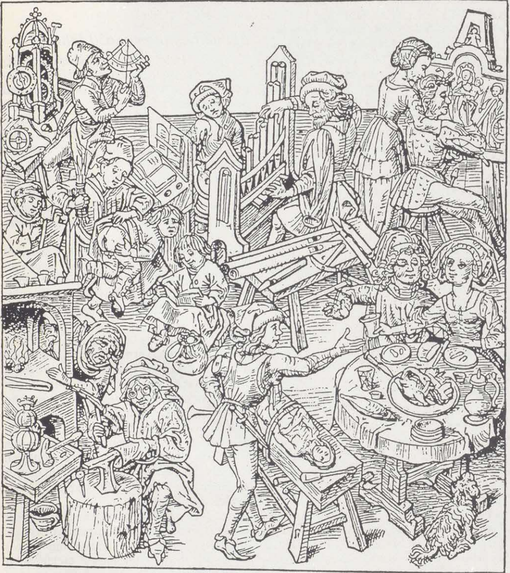
Das bürgerliche Leben in den mittelalterlichen Städten. Holzschnitt aus dem »Mittelalterlichen Hausbuch« DAMALS-Archiv

Graf Poppo I. der Starke stand im Dienste Kaiser Heinrichs VI. und fiel 1078 in der Schlacht bei Mellrichstadt. Poppo VI. be-