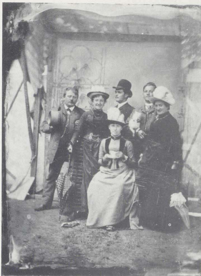
Abb. 4: Relativ preiswert wurden Ferrotypien, also Foto- grafien auf Eisenblech angeboten, die man im Schnellverfahren auf Jahrmärkten anfertigte. Sie wurden mit einem Passepartout versehen, das hier fehlt und somit die "Atelier"-Situation preisgibt, 1880er Jahre, Visit

(Daguerreotypen) oder Glasplatten (Ambrotypen). Vereinzelt wurde auch auf mit Kollodium beschichtetem Wachstuch oder Leder (Pannotypie) fotografiert. Die solchermaßen gefertigten Bilder waren allesamt Unikate, das heißt sie waren negative Spiegelbilder, die das Aufgenommene seitenverkehrt wiedergaben und in bestimmten Blickwinkeln positiv erschienen oder die mit Hilfe eines Tricks, wie zum Beispiel die Ambrotypen, die rückseitig dunkel lackiert oder hinterlegt wurden, wie Positive wirkten. Von diesen Aufnahmen ließen sich keine Abzüge anfertigen. Jedes Bild mußte eigens aufgenommen werden, was