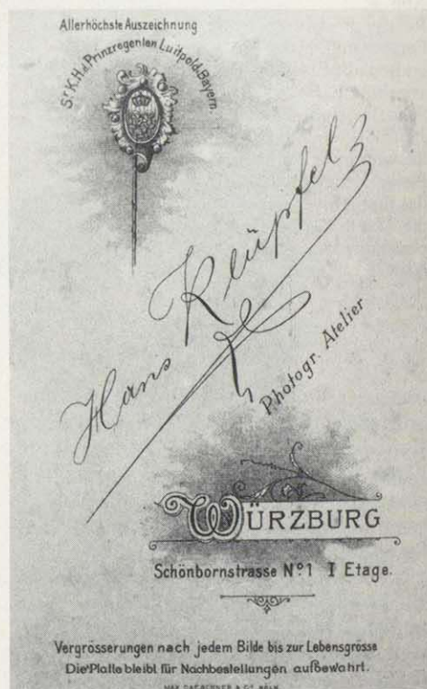
Abb.: 5 Die Rückseiten ihrer Bilder benutzten die Fotografen zu Werbezwecken. Visit, 1898

Vergleiche dazu: Görner, Karen: Fotografen und Fotografie in Würzburg bis 1933. Magisterarbeit (Ms.). Würzburg 1989. – Dies.: Würzburg. In: Historische Fotografie in Unterfranken (= Land und Leute, Veröffentlichungen zur Volkskunde, hg. v. Wolfgang Brückner). Würzburg 1989, S. 190 – 208.