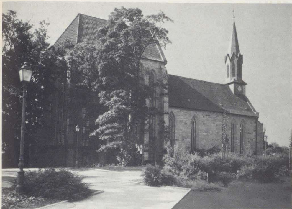
Die Klosterkirche Sonnefeld