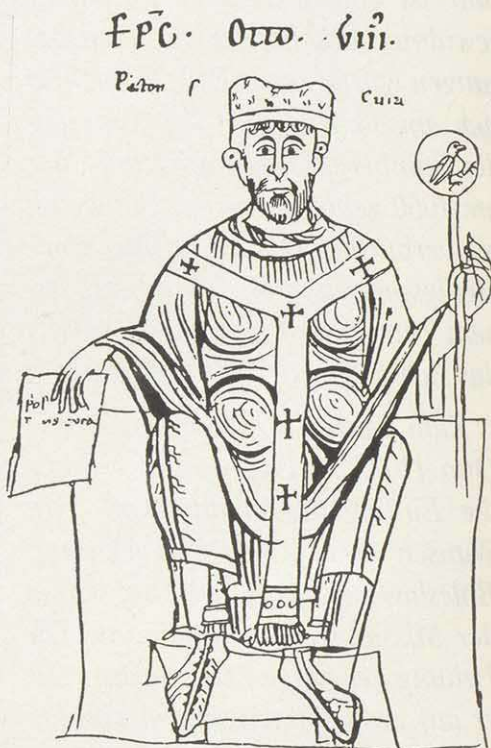
Otto der Heilige, Bischof von Bamberg. Federzeichnung in einer Michelsberger Handschrift. (Handschrift Patr. 76 der Staatsbibliothek Bamberg, Domplatz 8)

Nach fast vierzigjährigem segensreichen Wirken war Otto, der 8. Bamberger Bischof, am 30. Juni 1139 verstorben und auf seinen Wunsch hin nicht im Dom, sondern in der Kirche des von ihm besonders geförderten Benediktinerklosters auf dem Michelsberg beigesetzt worden. Zu Lebzeiten schon hochgeachtet und nach seinem Tode vor allem auf dem Michelsberg fromm verehrt, blieb das Gedenken an ihn immer lebendig. Schon unmittelbar nach Ottos Tod schrieb Probst Tiemo vom Michelsberg einen Bericht über die frommen Werke des Bischofs Otto.