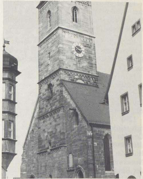
Liebfrauenmünster Wolframs-Eschenbach, 1230–1300 vom Deutschen Orden errichtet. Zu- gleich Grablage Wolfram von Eschenbach

Da 1306 noch ein Komtur (Albrecht der Schenk) zu Eschenbach erwähnt wird, (28) dürfte wohl die Incorporation nicht vor 1306 stattgefunden haben. Nach der Incorporation bis zum Ende der Ordensherrschaft 1796 wurde zur Verwaltung des Amtes Eschenbach vom Orden in Eschenbach ein Amtmann und später Vögte, die bis auf wenige Ausnahmen weltliche Beamte und keine Mitglieder des Deutschen Ordens waren, eingesetzt.