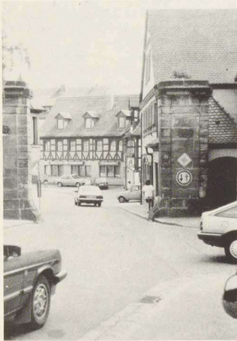
Das untere Tor in Heilsbronn

Es ist weitgehend unbekannt bzw. der Vergessenheit anheimgefallen, daß das untere Tor in Heilsbronn vor knapp 200 Jahren eine völlig andere Gestalt hatte. An dieser Stelle existierte in der Klosterzeit nur ein "Türlein" für Fußgänger. Erst Ende des 17. Jahrhunderts erweiterte man dieses "Nürnberger Pfortlein" zu einem Fahrtor. 1722 wurde es nochmal umgebaut und blieb in dieser Form bis ca. 1800 stehen wie es durch die kürzlich vom Verfasser im Staatsarchiv Nürnberg aufgefundene Zeichnung veranschaulicht wird, also mit einer überbauten Wohnung aus Fachwerk, ähnlich dem heutigen oberen Tor in Heilsbronn, auch Ansbacher Tor" genannt. Auf beiden Seiten war es eingegrenzt