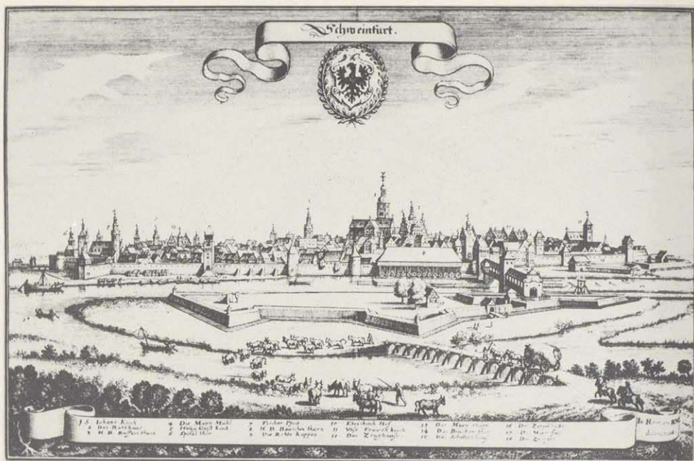
Südansicht Schweinfurts von Matthäus Merian d. Ä. (1646/1648)

Neben der Übernahme des archiwürdigen Registraturgutes der genannten Stellen ist es Aufgabe des Stadtarchivs, durch gezielte Sammlungstätigkeit eine sogenannte Ergänzungsdokumentation zu betreiben. Diese Ergänzungsdokumentation hat das Ziel, den durch Kriegseinwirkung oder gezielte Vernichtung verursachten Schwund an Registra-