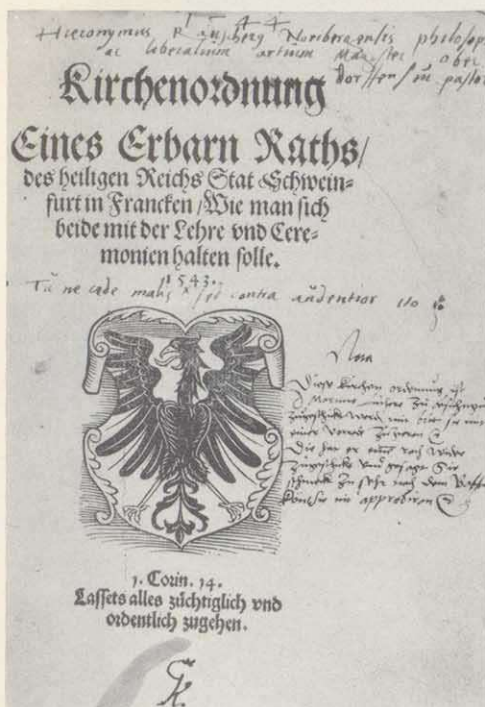
Titelblatt der Schweinfurter Kirchenordnung (1543)

Bände. Einen der wertvollsten Teile stellen die über 100 astronomischen Bücher und Handschriften aus dem Nachlaß der Altdorfer Gelehrten Johannes Praetorius (1537–1616) und Petrus Saxonius (1591–1625), – unter ihnen das Hauptwerk des Copernicus "De revolutionibus orbium coelestium", 1543 – dar. Ihren wichtigsten Zuwachs erfuhr die Stadtbibliothek 1813 durch die Stiftung der Bibliothek des Gründers der Deutschen Akademie der Naturforscher Leopoldina, Johann Laurentius Bausch (1605–1655), die ca. 2500 Einzelschriften umfaßt. Sie enthält nicht nur eine große Anzahl wichtiger Werke des 16. und 17. Jahrhunderts, sondern ist als eine nahezu vollständig erhaltene Gelehrtenbibliothek des 17. Jahrhunderts als Rarität ersten Ranges einzustufen und für die Wissenschaftsgeschichte von immenser Bedeutung.