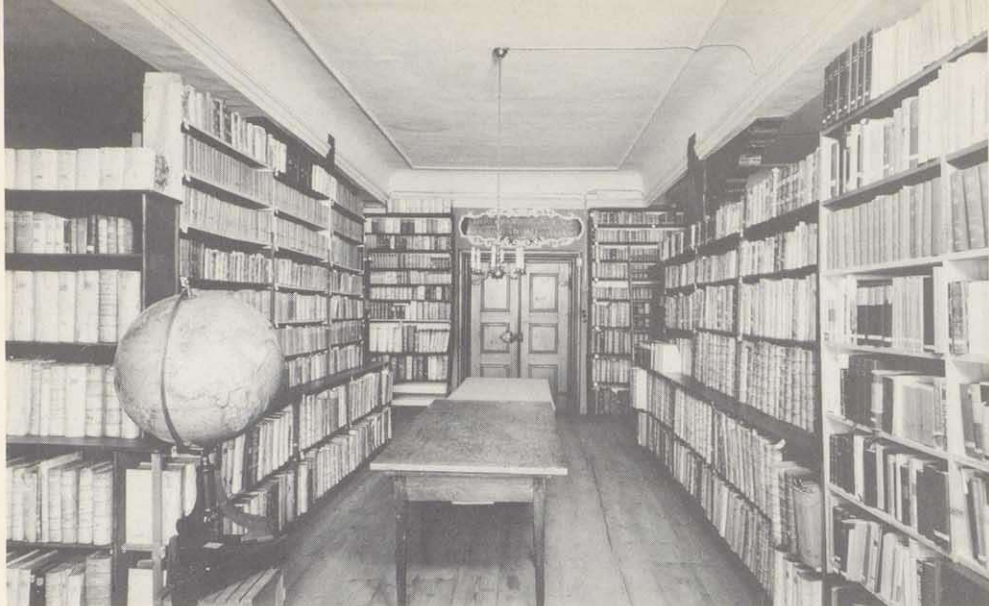
Reichsstädtische Bibliothek (Zustand vor 1958) im Südflügel des Alten Rathauses zu Schweinfurt

(1720–1791), die Sattler-Briefe und vor allem die Sammlung Dr. Rüdiger Rückert. Sie wurde im Jahre 1957 von der Stadt Schweinfurt vom gleichnamigen Urenkel des Dichters käuflich erworben. Die ca. 85.000 Einheiten umfassende Sammlung setzt sich im wesentlichen aus zwei Teilen zusammen, zum einen aus den Nachlässen der Familie Rückert und zum anderen aus denen der Weimarer Familien Bertuch und Froriep.