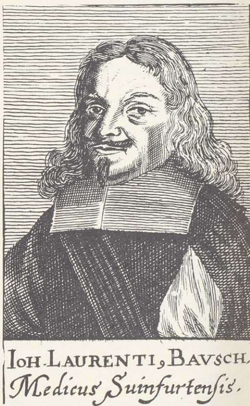
Johann Laurentius Bausch (1605–1665), Stadtphysikus und Gründer der Deutschen Akademie der Naturforscher Leopoldina (1652)

Die Stadtbibliothek geht in ihren ältesten Teilen zurück auf die Kirchenbibliothek von St. Johannis und die Kanzleibibliothek im Rathaus, die beide kurz nach dem Stadtverderben von 1554 entstanden sein dürften. Sie wurden 1664 zur Rathausbibliothek vereinigt, 1741 wurde ein neuer Bibliothekssaal eingerichtet. Beim Übergang der Reichsstadt an Bayern umfaßte der Bestand der bedeutendsten reichsstädtischen Bibliothek in Franken nach der Nürnberger rund 6500