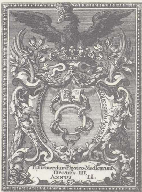
Wappen der Leopoldina mit dem Wahlspruch "numquam otiosus" (= niemals müßig)