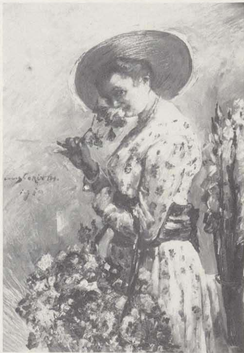
Lovis Corinth: Flora, 1924, Sammlung Georg Schäfer, Schweinfurt