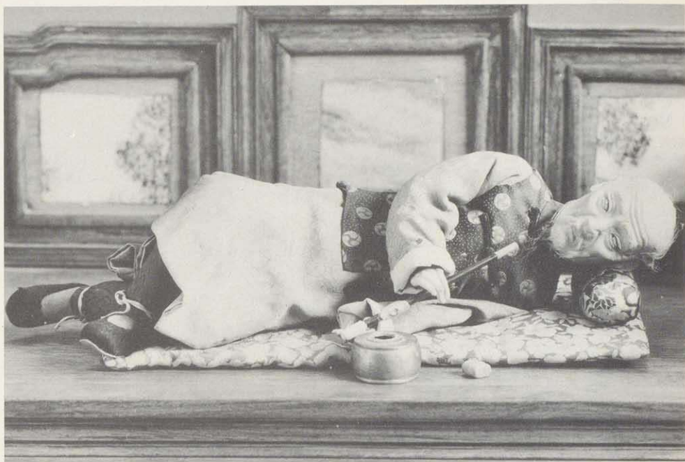
Der aus China stammende "opiumrauchende Greis" von 1932 gehört in die Trachtengruppen-Sammlung des Museums der Deutschen Spielzeugindustrie in Neustadt bei Coburg.