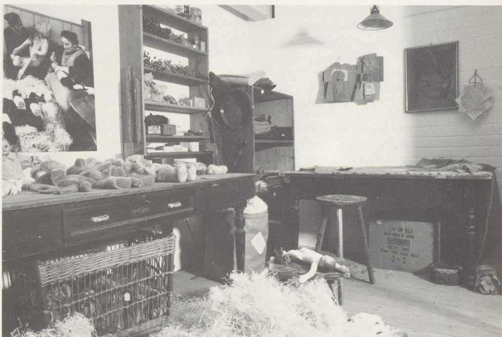
Im Museum der Deutschen Spielzeugindustrie wurde die "Puppen- und Tierstopferei um 1935" nachempfunden (1987).

Es ist unmöglich, im Rahmen dieser gedrängten Übersicht diese außergewöhnliche Sammlung auch nur annähernd zu beschreiben. Man muß sie, möglichst in Ruhe und Vitrine nach Vitrine, erleben. Auch bei wiederholten Besuchen wird man immer wieder neue Köstlichkeiten entdecken, Überraschungen erleben und interessante Infor-