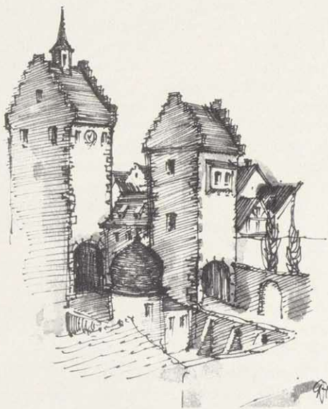
1833 wurde als erstes der Schweinfurter Tore das Brückentor abgerissen.