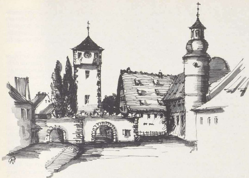
Das Spitaltor mit der Spitalkirche von der Stadtseite gesehen. (Abgerissen 1865)

dung, alle Hilfe kamen "von oben". In der Reichsstadt Schweinfurt fand eine Einübung freier, selbstverantwortlicher politischer Tätigkeit statt. So, meinen wenigstens wir Schweinfurter, wurde der Boden für die zukünftige Entwicklung, für einen Neuanfang vorbereitet.