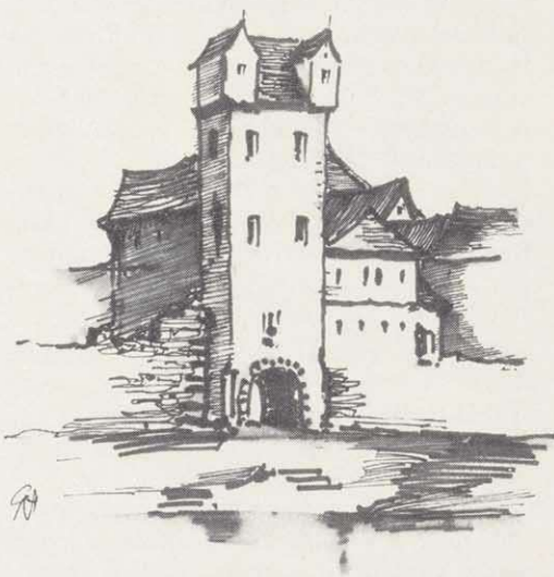
Die Fischerpforte (1853 mußte sie dem Bau der Eisenbahn weichen)