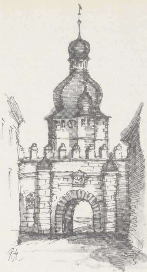
Das Mühltor (abgerissen 1876)

Auch das Stadtgebiet wurde getroffen, doch die geplante Vernichtung, mit dem