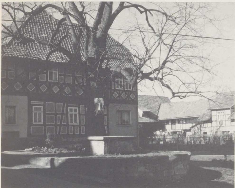
Eine solche Gerichtslinde findet sich auch noch im südthüringischen Linden im Landkreis Hildburghausen.

durch das Gericht öffentlich an den Pranger gestellt und dadurch Angeber- und Verleumdertum wirksam bestraft.