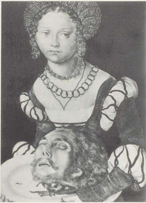
Salome mit dem Haupt Johannes des Täufers.

Die Fränkische Galerie auf der Festung Rosenberg zu Kronach als Zweigmuseum des Bayerischen Nationalmuseums vereinigt in 25 Schauräumen bisher verstreute und wenig gezeigte fränkische Kunstwerke aus dem Mittelalter und der Renaissance (13. bis 16. Jhdt.). Das Schwergewicht der Ausstellung liegt auf der fränkischen Kunst der Spätgotik und der Dürerzeit, hinzu kom-