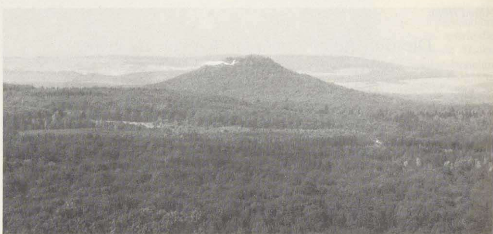
Abb. 1 Der Berg Straufhain, auf dessen Kegel die Burg Strauf stand

Burg Henneberg war der Stützpunkt, von dem aus er den Aufbau der Herrschaft Coburg in Angriff nahm.