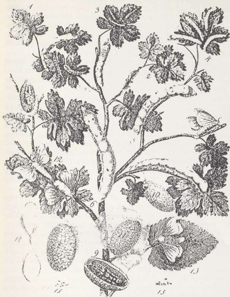
Abb. 5: "Darstellung des Lebenslaufes der Seidenraupe vom Entstehen bis wieder zum Eychen" (Quelle: HAZZI 1826, illuminierte Beilage)

auf, manchmal erst kurz vor dem Einspinnen, so daß die ganze Mühe umsonst war. Kennzeichnend für die von Jahr zu Jahr extrem schwankenden Erfolge ist eine Aufzeichnungsreihe des Kantors Goebel in Burghaslach/Mfr.: Von 32 Maulbeerbüschen bekam er 1842 280, 1843 600 Kokons; 1844/45 steigerte er die Nahrungsbasis auf 50 Bäume, schonte diese drei Jahre lang, erzielte 1847 9000 Kokons (17½ Pfund), sah 1848, 1849 und 1850 alle Raupen zugrunde gehen; danach war ihm die Lust auf neue Versuche verleidet (STAN, Nr. 4975). Für ganz Unterfranken schätzte HOFFMANN (1839, S. 434) das Jahresergebnis nicht höher als 400–500 Pfund Kokons.