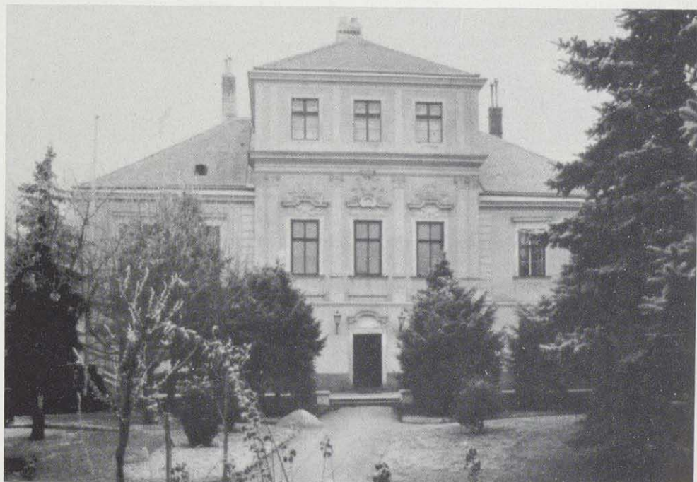
Sickenbergerschloß außen, abgetragen 1955