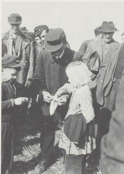
Ein Los wird gezogen