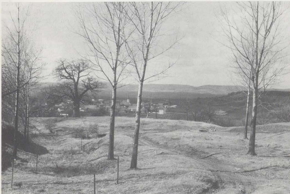
Blick vom Osing mit der "Kalten Eiche" auf Krautostheim, eines der vier Osingdörfer.

Über das Alter und die Entstehung dieser Landnutzung auf dem Osing ist viel vermutet worden. Einen ersten urkundlichen Nachweis beinhaltet der Osingbrief vom 4. Oktober 1587. Grund für diese Beurkundung war ein Streit zwischen einem Allmendberechtigten und der Nutzungsgemeinschaft. Der Inhalt bestätigt lediglich einen schon länger bestehenden Zustand und spricht "von einer alten Stiftung her-