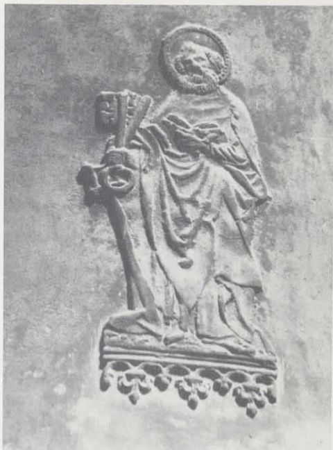
Detail von der "Banzer": Der Hl. Petrus mit den Himmelsschlüsseln

Wir verstehen gut, daß die Benediktiner gleich in den folgenden Wochen, als Ungarn und Kroaten in Eisfeld lagen, mit Wagen an-