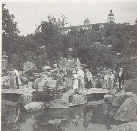
Stadt mit vielen internationalen Beziehungen – der von der Partnerstadt Otsu angelegte japanische Garten im Landesgartenschau-Gelände.

Zusammenfassung: Würzburg hat Profil – als kleine Großstadt, als ein urbanes Gesamtkunstwerk, in dem sich Lebensqualität, Atmosphäre, Kultur, Freizeitwert, Lebensfreude, moderne Standortqualität und Internationalität auf überschaubarem Raum harmonisch verbinden.