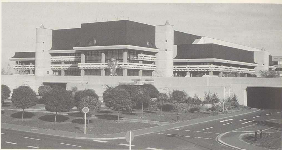
Die Universität am Hubland – moderne Seiten einer traditionsreichen Institution.

dingungen für eine moderne Grundlagenforschung auf internationalem Standard. Zur Entsorgung des Umweltgiftes Kohlendioxid ( \text{CO}_2 ) hat das Institut für Physik der Würzburger Universität weltweite Anstöße gegeben. Die Standortinnovation C.A.R.M.E.N. (= Centrales-Agrar-Rohstoff-Marketing-Entwicklungs-Netzwerk) in Rimpar ist die bayेरische Koordinationsstelle für Verwertung und Entwicklung nachwachsender Rohstoffe.