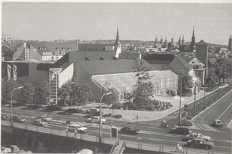
Optimale Verkehrsverbindungen und das besondere kulturelle Angebot machen Würzburg zur vielgefragten Tagungs- und Kongressstadt. Das Congress-Centrum an der Friedensbrücke.

Die Struktur und modernste Technologie der Gewerbebetriebe ersparen der Stadt einen Großteil der für diesen Sektor typischen Umweltprobleme. Der Luftreinhaltung dient auch die städtische Energiepolitik. So wird seit langem ein Großteil der Stadt mit Fernwärme versorgt – das Heizkraftwerk mit moderner Rauchgasreinigung und Entschwefelung ersetzt zahllose Einzelfeuerungsanlagen. Die Luftschadstoffe sind überwiegend durch den Autoverkehr verursacht. Die hohe