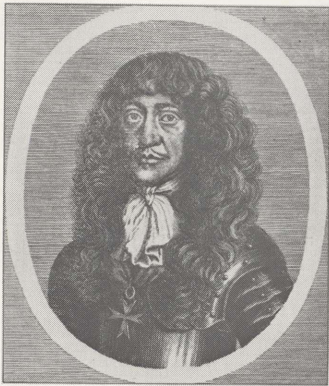
Georg Friedrich Fürst von Waldeck

setzt werden. Die anwesenden Kriegsräte erhielten den Auftrag, sofort die Marschroute zu entwerfen 37) .