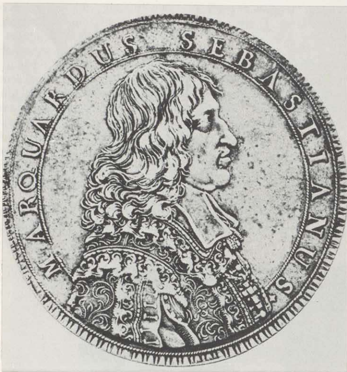
Fürstbischof Marquard Sebastian Schenk von Stauffenberg, Bamberg (1683–1693)

war der Würzburger Fürstbischof schon am 25. Juli nach Haßfurt gereist 31) .