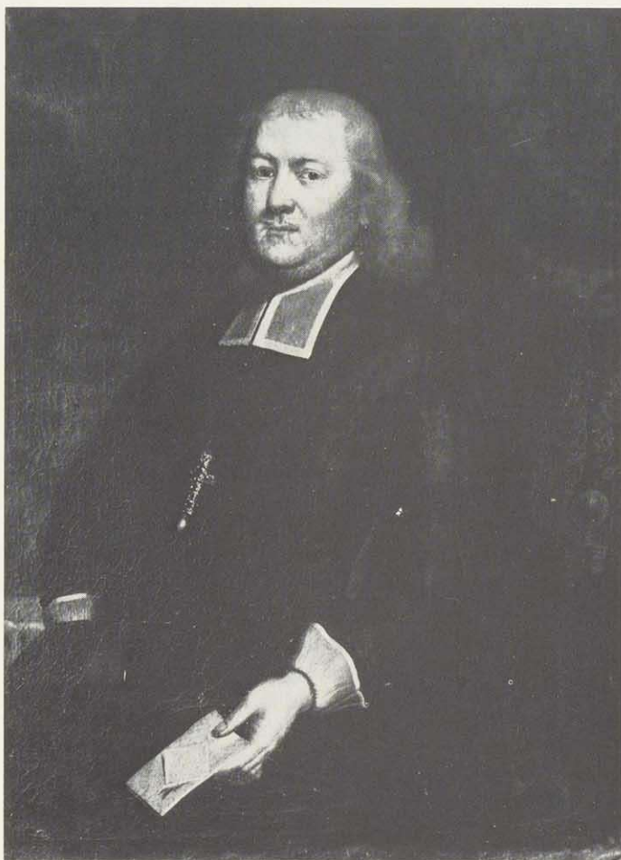
Fürstbischof Konrad Wilhelm von Werdenau-Würzburg (1683–1684)

Dessen ungeachtet sollen jedoch die fränkischen Truppen schon vorher in Marsch ge-