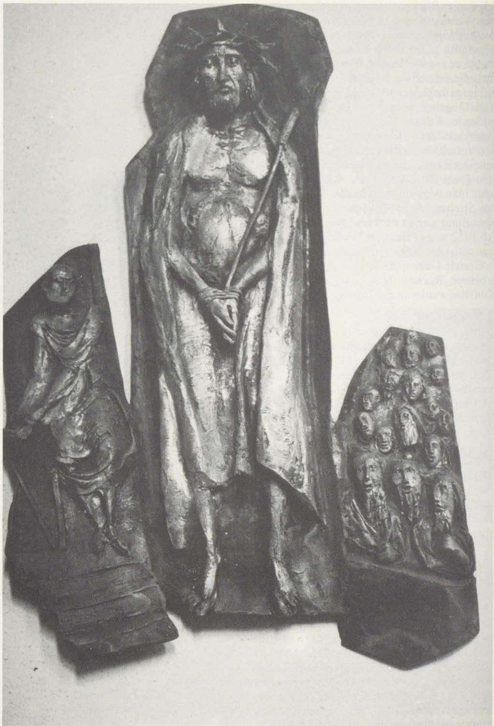
Kreuzwegstation in der Marienkapelle in Bad Kissingen