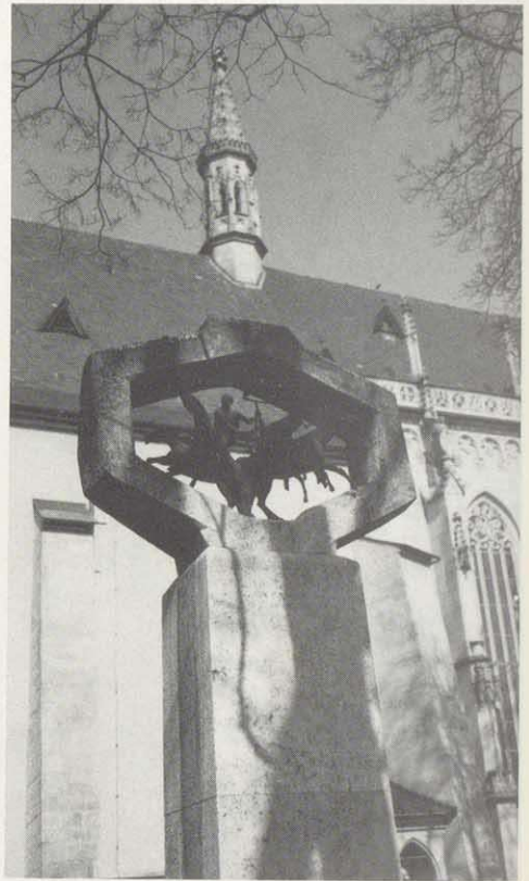
Kriegerdenkmal 2. Weltkrieg in Haßfurt

So also stellte sich der Künstler dar, dessen Oeuvre fast ausschließlich aus Sakralwerken besteht, so wie er sich auch selbst ausdrücklich als christlicher Künstler verstanden hat.