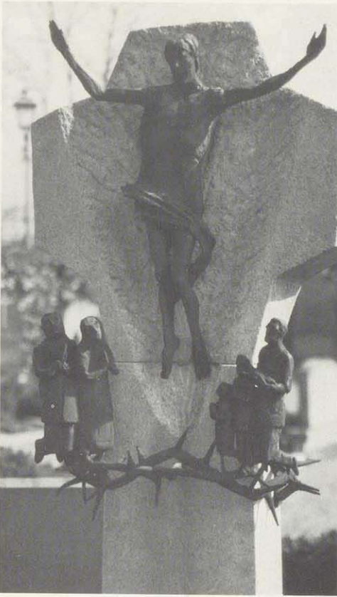
Familiengrab Rückel in Haßfurt