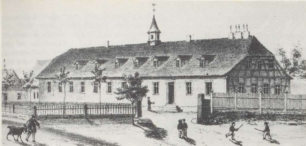
Das alte Haus im vorigen Jahrhundert