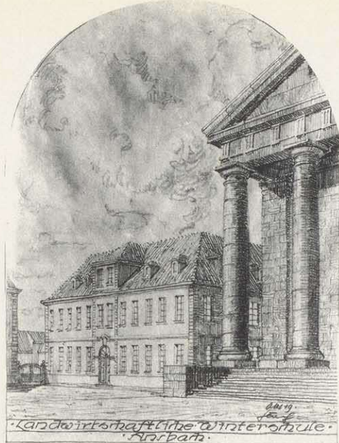
Die ehemalige Ansbacher Schranne neben der 1845 eingeweihten St. Ludwigs-Kirche wurde 1920 zur landwirtschaftlichen Weicherschule umgebaut (Architekturzeichnung von Willy Flach)

Im Zweiten Weltkrieg brachte es Flach bis zum Major. Auf Geheiß der Militärregierung wurde Willy Flach am 3. Oktober 1945 aus der Stadtverwaltung entlassen. Ab Oktober 1945 arbeitete er als freier Architekt; die Zulassung wurde jedoch wieder entzogen.