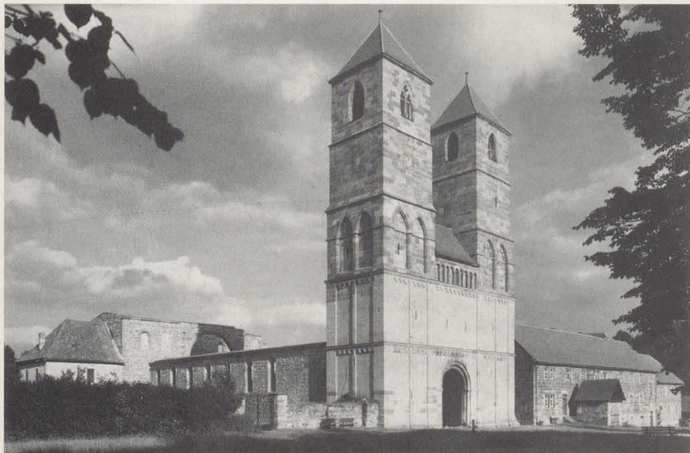
Veßra – das ehemalige hennebergische Hauskloster: Ruine der Kirche St. Marien mit Westbau und Klausur.

Da haben die Menschen diesseits und jenseits der bayerisch-thüringischen Landesgrenze, die quer durch das einstige Herr-