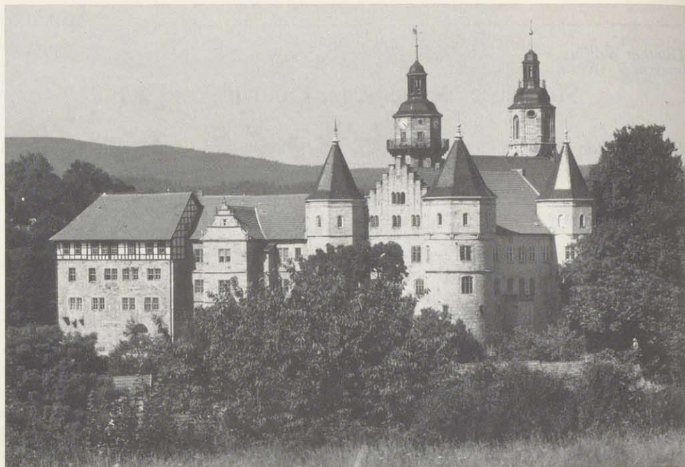
Die Bertholdsburg in Schleusingen – einst Residenz der hennebergischen Hauptlinie.

schaftsgebiet der Fürstgrafen von Henneberg läuft, nach den ersten Begeisterungstürmen über die Wiedervereinigung unseres Vaterlandes doch einige Probleme miteinander. Der Weg zur inneren Einheit ist schwieriger, als wir anfangs dachten; zu lange war die Trennung, zu groß die Entfremdung, als daß sich "Wessis" und "Ossis" immer gut verstehen und problemlos miteinander umgehen könnten. Innere Barrieren abzubauen, nachdem Stacheldraht und Grenztürme gefallen sind, ist deshalb eine Aufgabe, der wir uns noch einige Jahre stellen müssen. Was könnte es da Besseres geben, als auf eine gemeinsame Geschichte, auf gleiche Traditionen verweisen und zusammen ein Jubiläum feiern zu können, das uns das Verbindende unserer Vergangenheit deutlich macht und darüber hinaus Gelegenheit zu vielen Begegnungen bietet? Gerade auf diese Begegnungen kommt es doch an!