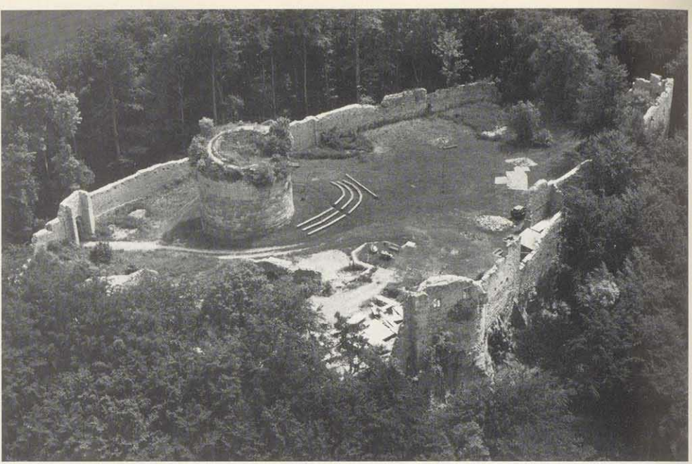
Ruine der Henneburg (zwischen Mellrichstadt und Meiningen gelegen).

zum Spätherbst noch eine Menge zu tun, zumal mit dem eigentlichen Henneberg-Jubiläum auch noch einige andere Gedenkfeiern wie das Luther-Jahr oder etliche Ortsjubiläen verbunden sind. Damit wird auch der Gedanke unterstrichen, daß mit der Feier "900 Jahre Henneberger Land" nicht nur auf die fürstliche Familie und ihre geschichtliche Bedeutung aufmerksam gemacht werden soll, sondern daß es sich um das Jubiläum des Landes überhaupt handelt.