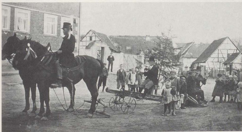
Dem Richtfest voraus ging ein Spektakel, um die gesamte Dorfbevölkerung auf das Ereignis aufmerksam zu machen.

Gegen 12 Uhr wurde Mittagspause eingelegt. Ein vergleichsweise üppiges Essen wurde aufgetischt. Schweine-, Rinder- oder Sauerbraten, dazu Thüringer Klöße. Zum Essen gab es meist auch Gemüse oder Kraut.