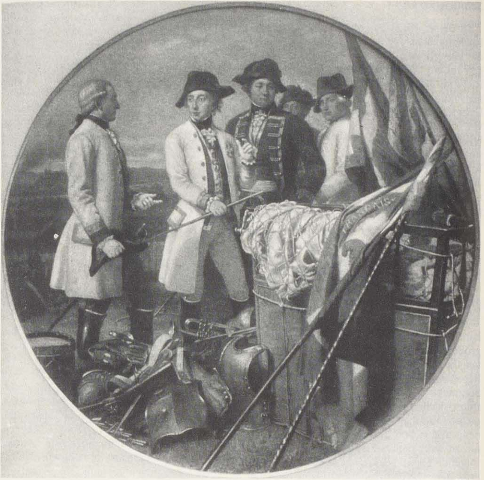
Abb. 3: Erzherzog Carl mit seinen Stabsoffizieren vor dem erbeuteten Heißluftballon. Darstellung des 19. Jahrhunderts.

zusammengebaut in der dazu eigens in Beschlag genommenen Kirche St. Afra.