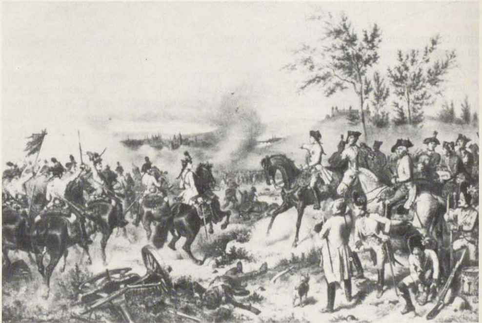
Abb. 2: Erzherzog Carl gibt den Angriffsbefehl zum entscheidenden Kavallerieangriff. Darstellung des 19. Jahrhunderts. Im Besitz des Mainfränkischen Museums Würzburg.

an sich gezogen. Mit dem Gefecht von Ebrach (25. August) verlegte sie den Franzosen den direkten Rückmarsch und zwang sie, rechtsmainisch weiter zurückzugehen. Erzherzog Carl war es auf diese Weise gelungen, die Franzosen von ihrer direkt nach Frankreich führenden westlichen Rückzugslinie in nördliche Richtung abzudrängen. Da er die linksmainische und zugleich kürzere Straße nach Würzburg kontrollierte, mußte Jourdan notgedrungen die längere, über Bamberg und Schweinfurt führende rechtsmainische Straße benutzen. Den nun beginnenden Wettlauf um das strategisch wichtige Würzburg, das mit seiner Mainbrücke den kürzesten Weg nach Westen über Remlingen und Aschaffenburg eröffnete, gewann der Erzherzog. Seine Vorausabteilung streifte bereits am 1. September auf dem Nikolausberg oberhalb Würzburg und nahm durch einen Handstreich die rechtsmainische Stadt in Besitz. Jourdan hingegen blieb am gleichen Tag noch rund dreißig Kilometer entfernt und traf erst in Schweinfurt ein.