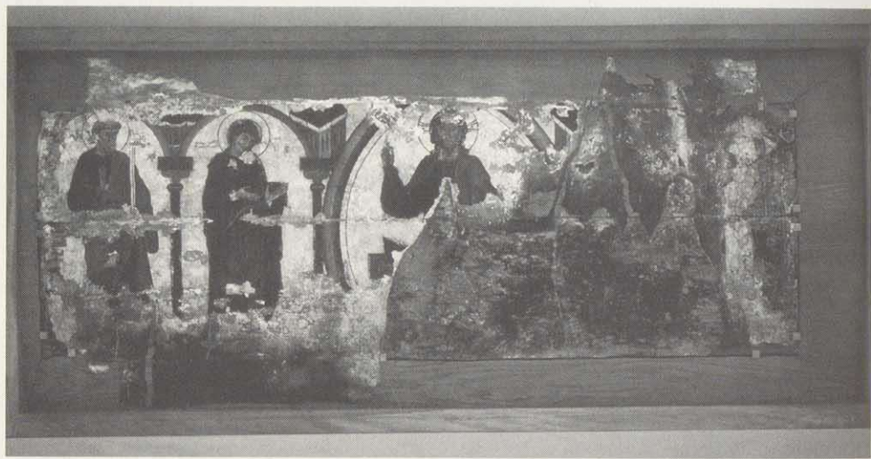
So präsentiert sich die Tafel jetzt im Museum

Das Bildprogramm der Tafel, das bereits durch die Kalkschicht hindurch größtenteils sichtbar war, ist nun eindeutig definiert: Im Zentrum der Tafel ist Christus als Pantokrator zu sehen, er thront in einer regenbogenfarbenen Mandorla mit segnend erhobener rechter Hand. Reste der Buchstaben A und Ω zu seinen Seiten seines Hauptes sind erhalten. Zu seiner Rechten steht fürbittend in einer schön gestalteten Arkade Maria, neben ihr ebenfalls arkadengerahmt der Hl. Petrus mit dem Schlüssel. Zur Linken Christi ist entsprechend dieser Deesis-Ikonographie Johannes der Täufer zu ergänzen – von ihm ist lediglich ein Fragment des Fellgewandes erhalten. Die Arkadenrah-