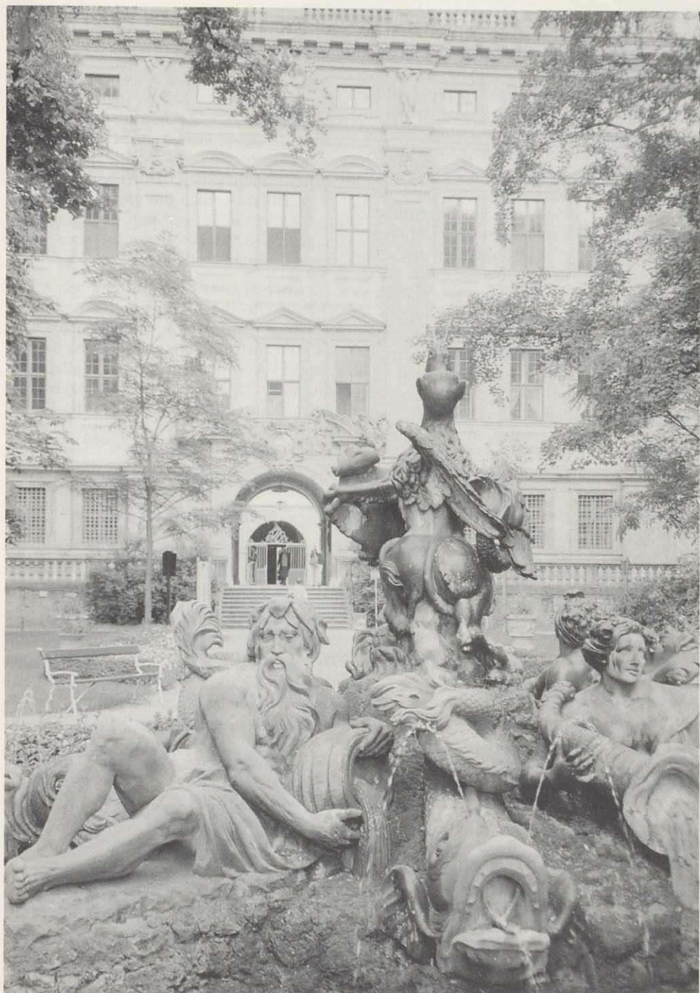
Ein prachtvolles Zeugnis barocker Architektur: Der „Fürstenbau“ des Würzburger Juliusspitals von der Parkseite.