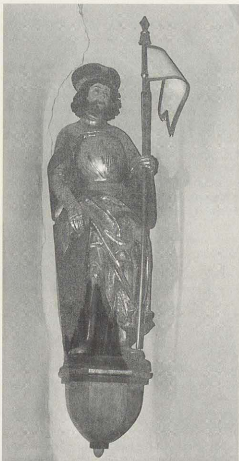
St. Wenzeslaus, Holzfigur, spätes 15. Jh., Evang.-Luth. Pfarrkirche St. Wenzeslaus in Hohenstadt bei Hersbruck.

Der in Böhmen besonders verehrte Heilige Wenzeslaus darf entlang der Straße von Böhmen nach Nürnberg nicht fehlen, er verkörpert heute noch die Erinnerung an die neuböhmische Zeit des Gebietes zu beiden Seiten der Fernstraße. Statuen des von Kaiser Karl IV. besonders geschätzten Patrons finden sich z. B. an der Stadtpfarrkirche in Sulzbach, in der Kirche von Hohenstadt bei Hersbruck und außen und innen an der Laufer Wenzelsburg.