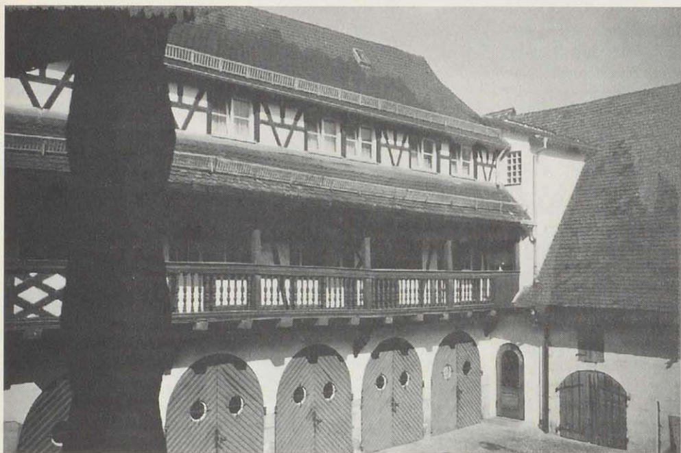
Blick in den Innenhof des Gasthofes zum Wilden Mann (ehemalige Fürstenherberge) in Lauf a. d. Pegnitz. In diesem Anwesen übernachtete Johannes Hus auf seiner Reise nach Konstanz im Herbst 1414.