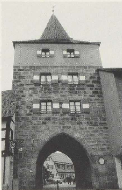
Oberes Tor in Lauf a. d. Pegnitz, Ausfahrt der Goldenen Straße in Richtung Oberpfalz und Böhmen. Im Bogendurchblick ist das Zollhaus zu erkennen, an dem Waren- und Pflasterzoll erhoben wurde.

Es genügt freilich nicht, einer Straße einen bestimmten Rang zuzuweisen und ihren Verlauf zu bestimmen. Sie muß auch gesichert