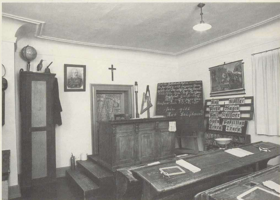
Ein Blick in das Klassenzimmer

Bewirkt hatte diesen grundlegenden Wandel die in Bayern zu Beginn der sechziger Jahre einsetzende Schulreform, deren erklärtes Ziel eine voll ausgebauten Schule für alle Kinder im Lande war. Mit dem organisatorischen Umbruch gingen topographische und soziologische Veränderungen einher: Gehörte bislang das Schulhaus, meist neben der Kir-