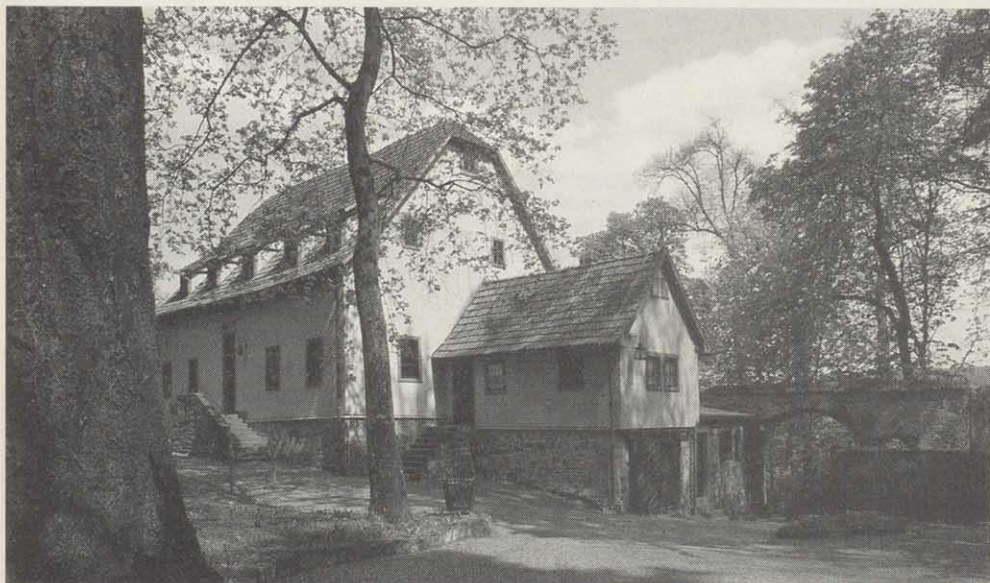
Das Haus, das das Schulmuseum beherbergt, wurde im Jahre 1774 errichtet

Das Aschacher Schulmuseum bewahrt das Andenken an die einstige Dorfschule