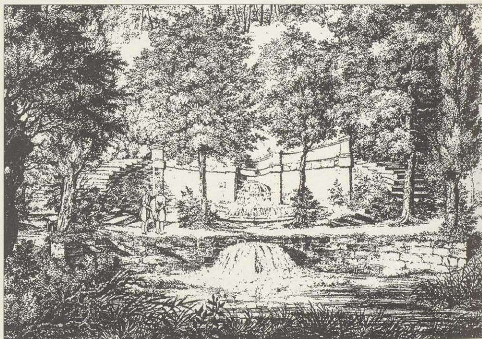
Sophienquelle bei Grünsberg.

„... Floridan fand allda den Schäfer Macarius / seinen lieben Verwandten: welcher ihn und seine Gesellschaft alsofort in das Haus hinein führte. Dieses war der so-genannte Rockenbrunn / dessen Umligenheit mit der innern Lustbarkeit wett-schönete: wie sie dann von ihrem Anführer erfuhren / daß diese Gegend im Lust hieße. Sie fanden darin einen offenen Platz an einem untermauerten Berg / oben von dreyen nebeneinander ligenden Spazirgängen gegen den Wänden bedeckt. Unter dem mittelsten erschienen drey ausgemauerte Schwibbögen: und gieng man /