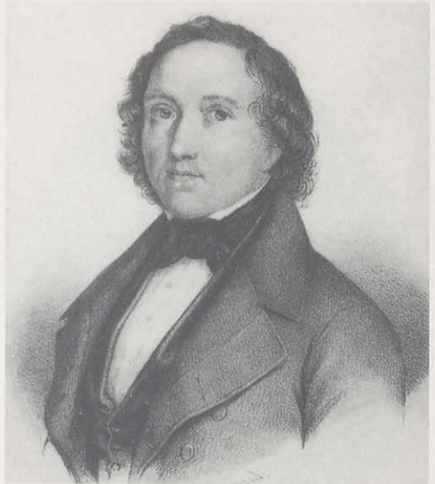
Johann Georg August Wirth

Es waren unruhige Zeiten, in die Johann Georg August Wirth am 20. November 1798 als Sohn des Reichspoststallmeisters Johann Adam Wirth im oberfränkischen Hof hineingeboren wurde. Der Sturm auf die Bastille lag gerade neun Jahre zurück und Europa stand im Zeichen der Auswirkungen der großen französischen Revolution. Sein Geburtsort Hof, damals ein Städtchen von 6.000 Einwohnern, war nach der Abdankung des letzten Markgrafen Alexander von Brandenburg-Ansbach-Bayreuth im Dezember 1791 preußisch geworden. Nach dem Frieden von Tilsit stand es mit den übrigen Gebieten des ehemaligen Markgraftums Bayreuth für vier Jahre unter französischer Herrschaft, ehe es 1810 an das Königreich Bayern fiel.